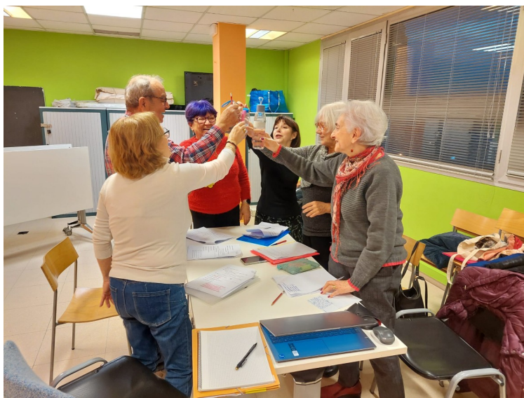
Trobada de preparació de l'activitat