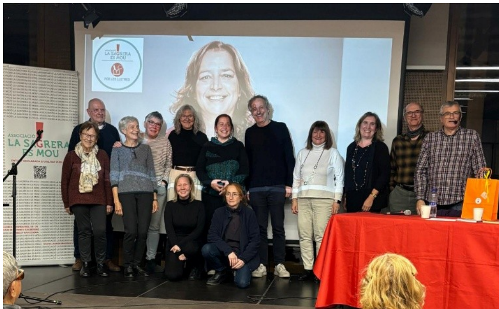
Sessió literària del 21 de novembre