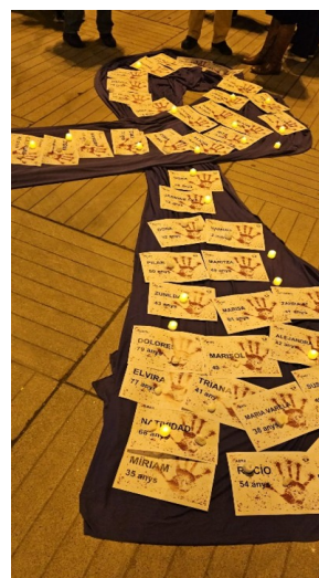
Concentració contra la violència masclista