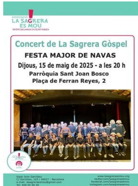
Cartell de l'actuació a la Festa Major de Navas