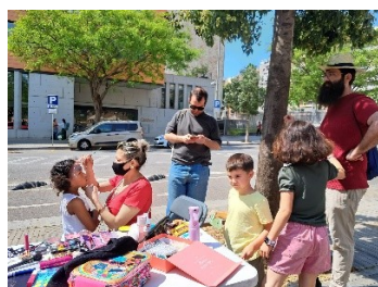
Taller de maquillatge