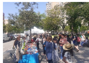
Paradetes al carrer Garcilaso