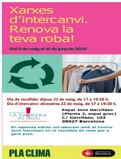
Cartell de l'activitat

El sobrant de roba que tenim es reparteix entre l'entitat T'acompanyem i Roba Amiga (de l'Ajuntament), que passa a recollir el sobrant.