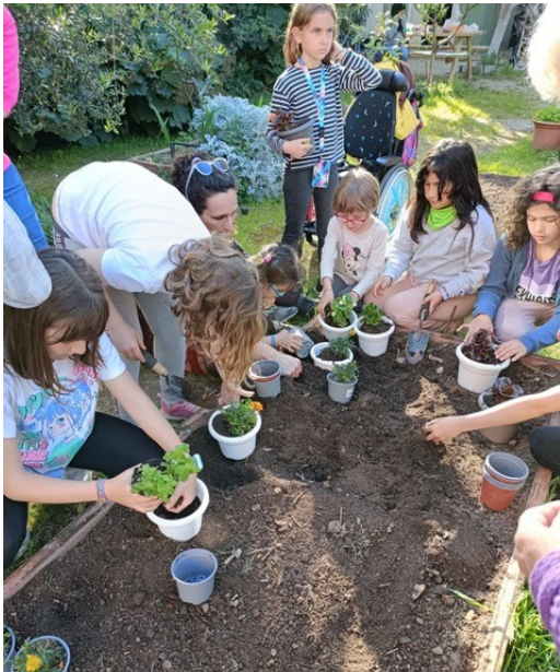
Taller a l'Hort Camp del Ferro 8 d'abril