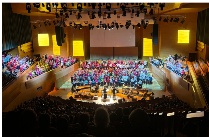
Canta Gran. Cantata: La Ciutat (Auditori)