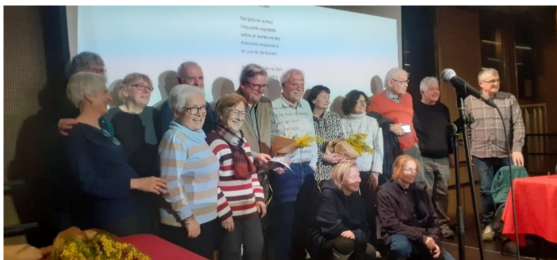
Sessió literària del 21 de febrer