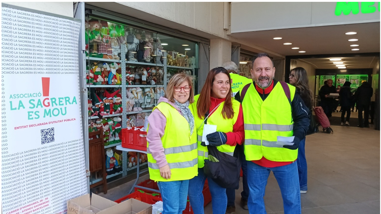
Punt de recollida de LSEM durant la Festa Major de la Sagrera (29 de novembre de 2025)