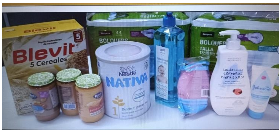
Contingut de cada lot