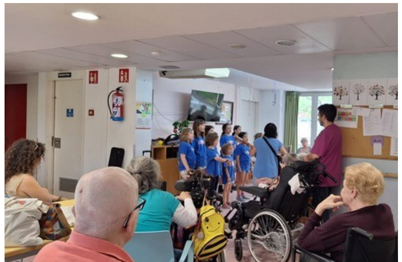
Concert a la Residència de gent gran 3 de juny