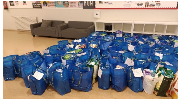
Espai de l'Escola Estel