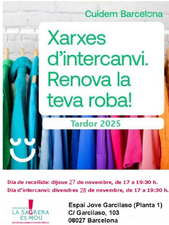
Cartell de l'activitat

barri per cadascuna de les associacions que hi participen. En aquesta edició vàrem continuar la nostra presència al Centre Jove Garcilaso i el resultat d'assistència el podem qualificar de força exitós.