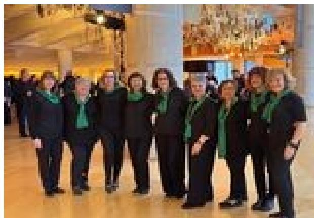
GOSPELFEST 2025 (Barcelona)