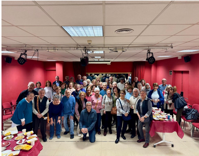
Vermut celebració 5è aniversari LSEM pel Territori. (Auditori Espai Jove Garcilaso. Barcelona)