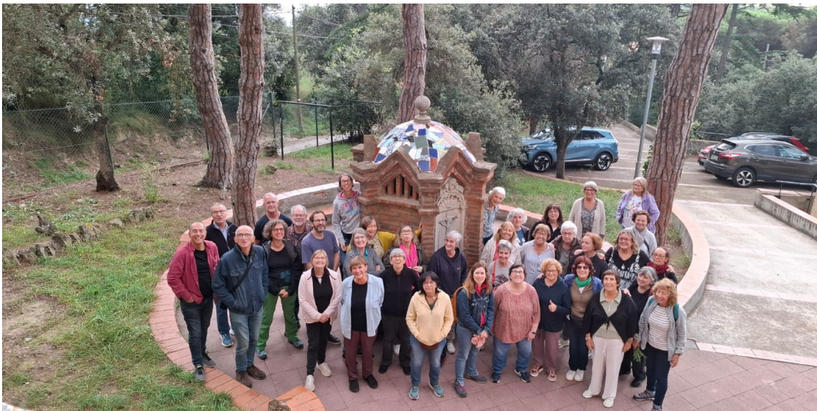
Cap de setmana de treball a la casa colònies Mas Pi Canyonó (La Conreria)