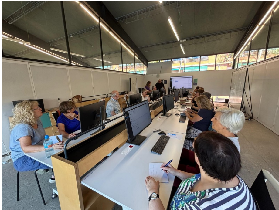
Sessió de formació

S'ha decidit comptar amb els serveis d'una empresa externa (Enxarxada) per al seu disseny, edició i implementació. És previst presentar la nova web el mes de març del 2025.