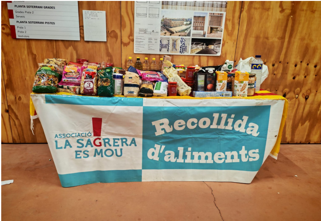
Taula de recollida del Club Patí Congrés durant el festival Barrufets (11 de setembre de 2025)