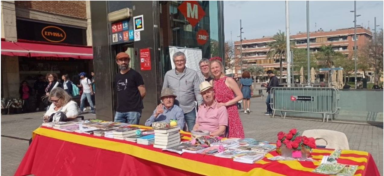
Exposició, venda i signatura de llibres d'autors locals del 23 d'abril