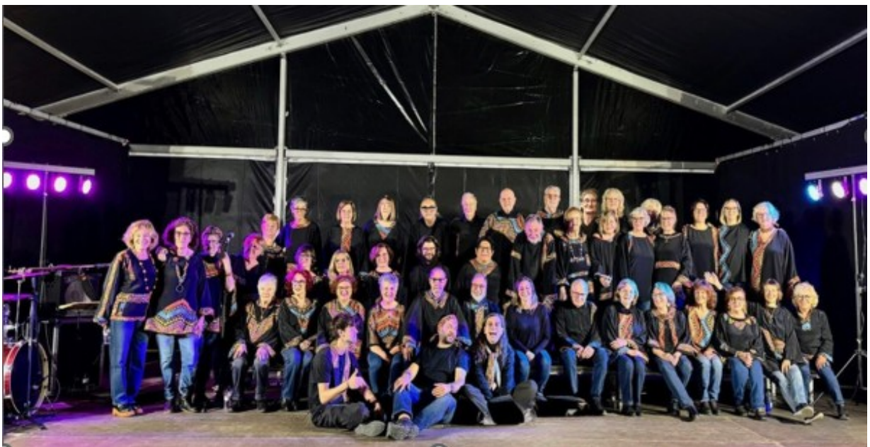
Concert de Festa Major al Barri de La Sagrera