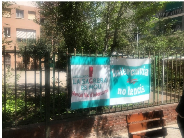
Cartells de l'activitat