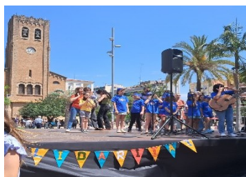
La Coral 6-12