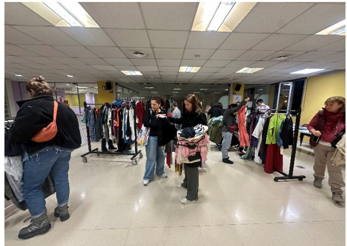
Renova la teva roba (Primavera)

Tardor 2025: Va tenir lloc els dies 27 i 28 de Novembre.