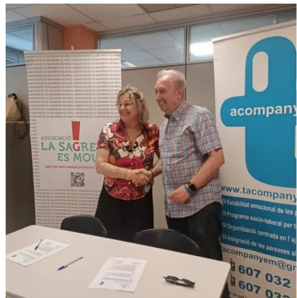
Signatures de col·laboració amb el SAAC i T'acompanyem