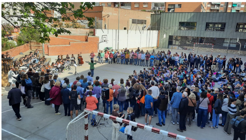
Caramelles al pati de l'escola El Sagrer