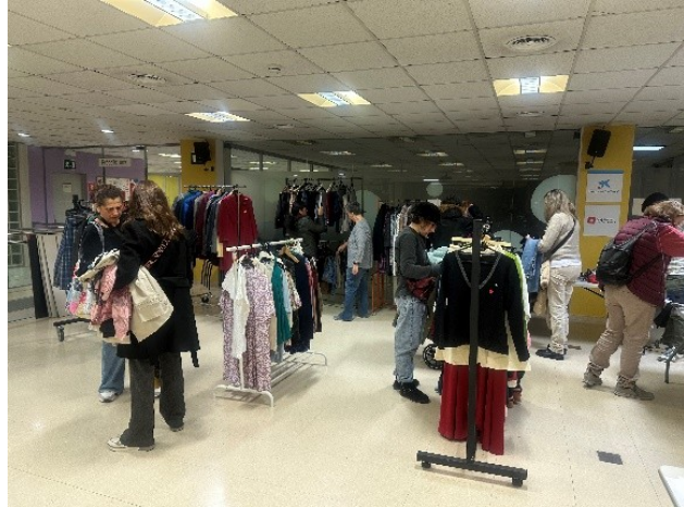
Renova la teva roba (Tardor)

Voluntaris: Aquesta acció va comptar amb la presència de 7 voluntaris, repartits entre els dos dies de la convocatòria.