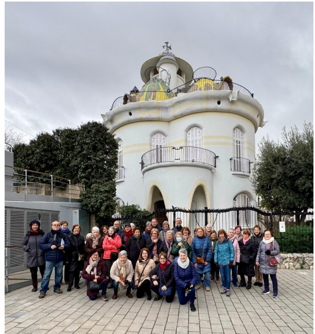
Itinerari Jujol. Sant Joan Despí.