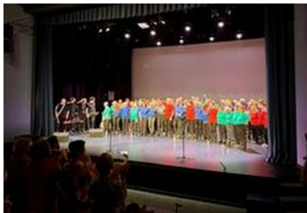
Concert Teatre SAT (Barcelona)