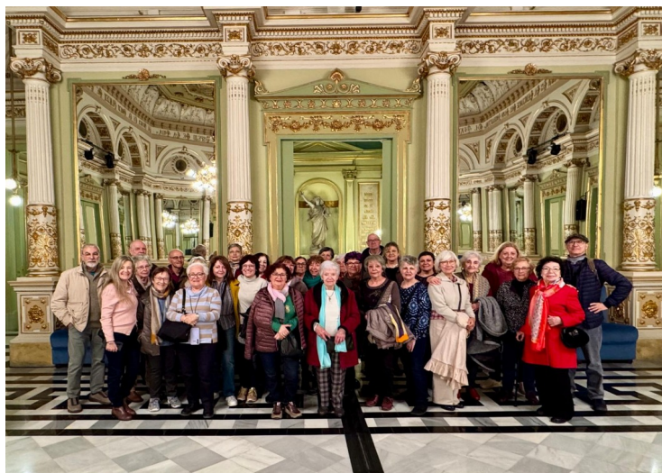
Visita guiada al Gran Teatre del Liceu de Barcelona.