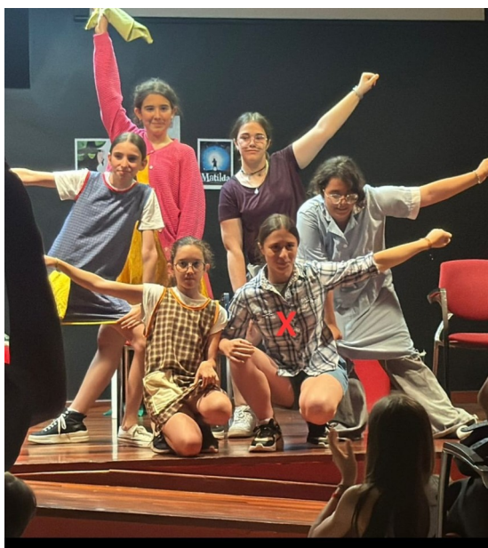
Actuació del 10 de juny