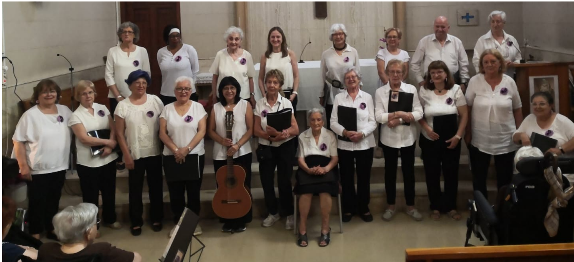
Concert a la casa Asil de Sant Andreu