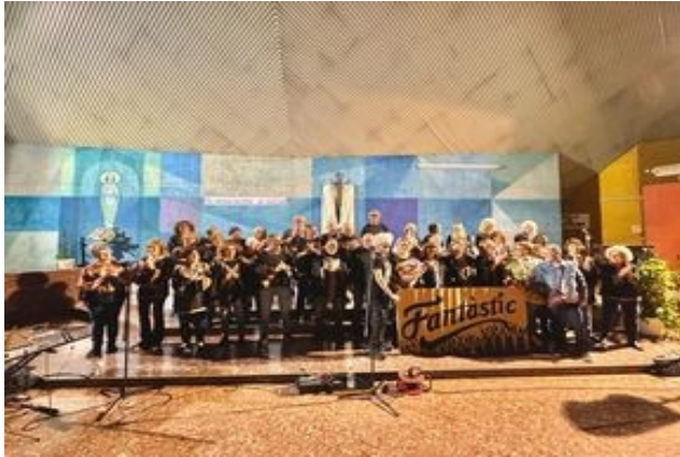
9/5/24 - Parròquia de St. Joan Bosco a les 20h. en el marc de la Festa Major del Barri de Navas (34 cantaires)