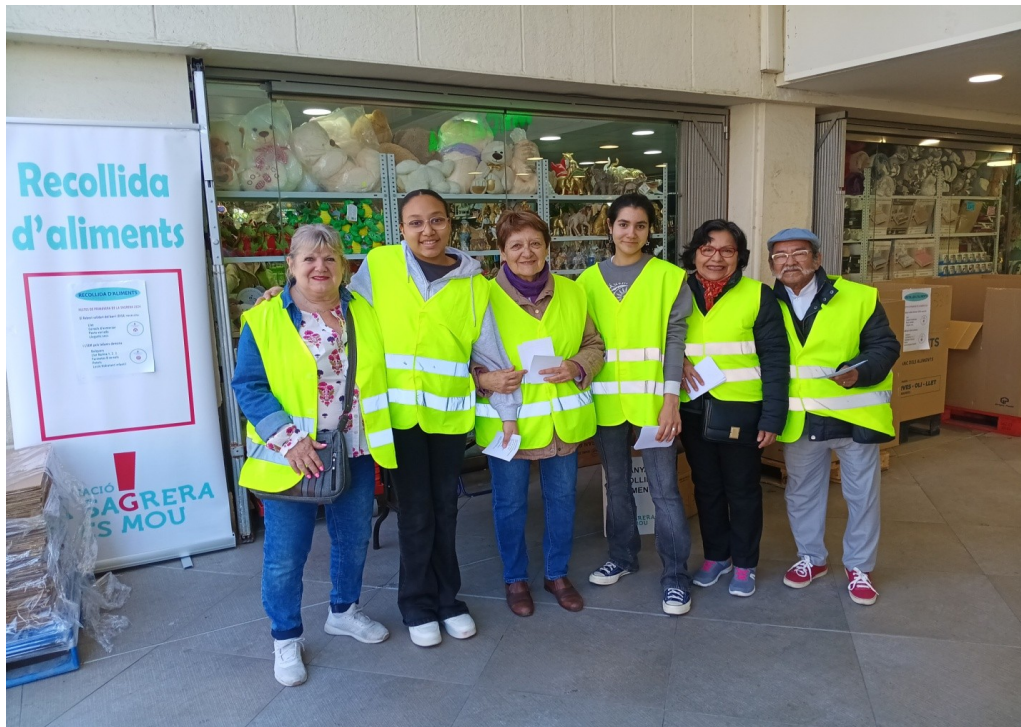
Equip de voluntaris durant la recollida del 20 d'abril de 2024