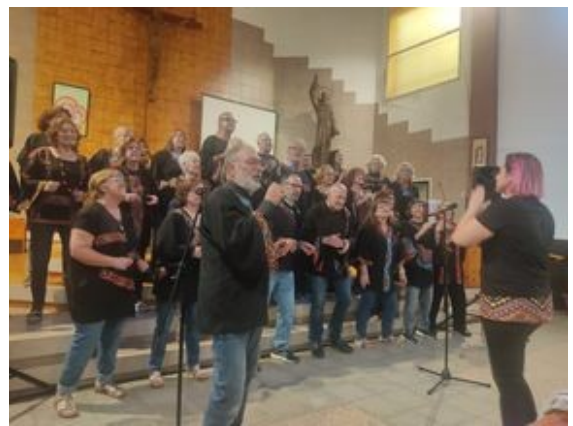
15/6/24 - Parròquia St, Antoni de Llefià (Badalona) en el marc de la Festes de Sant Antoni (25 cantaires)