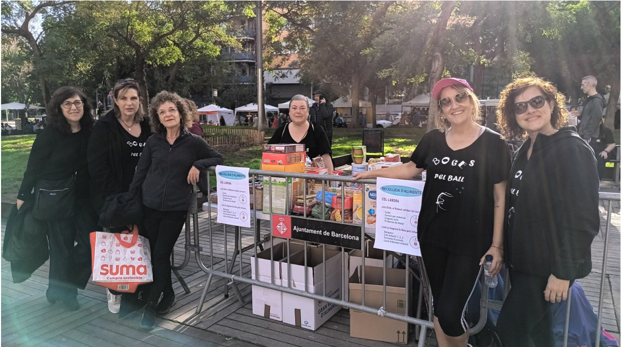
Punt de recollida amb la participació de Boges pel Ball, a la Festa Major de la Sagrera