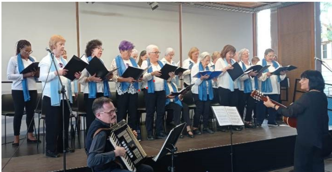
Concert Remor de Mar a la Torre de la Sagrera

www.lasagreaesmu.org twitter.com/lasagreaesmu facebook.com/lasagreaesmu instagram.com/lasagreaesmu