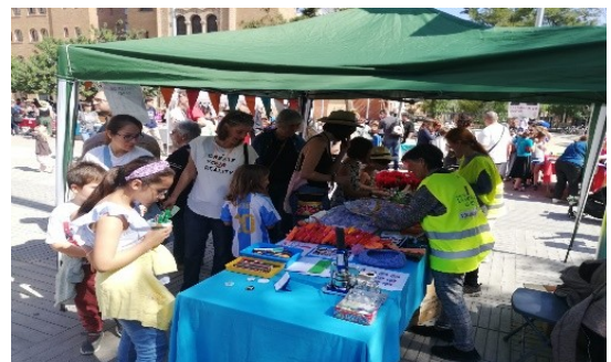
Venda d'objectes a la parada de voluntaris