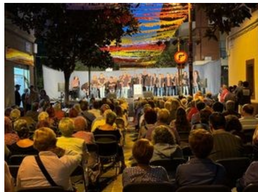
25/9/24 – Carrer Jordi de Sant Jordi, en el marc de la Festa Major del Barri dels Indians (25 cantaires)