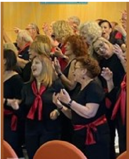
20/6/24 - Concert conjunt amb New Gòspel a l'auditori del Tanatori Àltima de l'Hospitalet, primer concert organitzat per Àltima per apropar-se als veïns i veïnes de l'Hospitalet (38 cantaires)