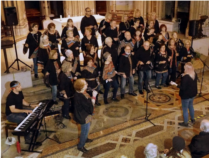
18/2/24 - Parròquia de St. Pacià (St. Andreu) (31 cantaires)

Al 2024, La Sagrera Gòspel ha fet els 7 concerts següents, amb una durada d'una hora i quart aproximadament. Han tingut molt bona acollida per part del públic, amb una assistència mitjana de 200 persones: