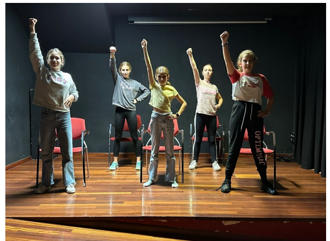
Assaig, novembre de 2024, Sala auditori de l'Espai Jove Garcilaso