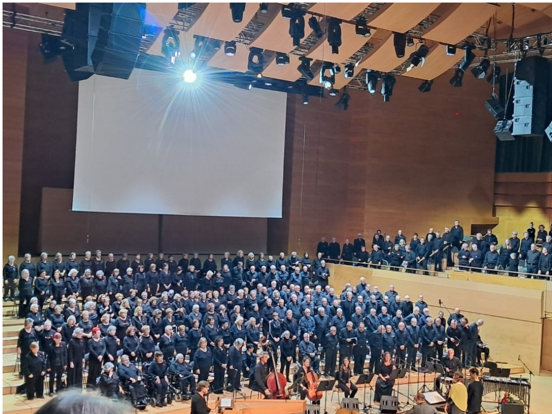
Concert la BAGUET I LA ROSA Sala Pau Casals de l'Auditori de Barcelona