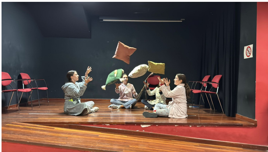
Actuació 17 de desembre, Espai Garcilaso