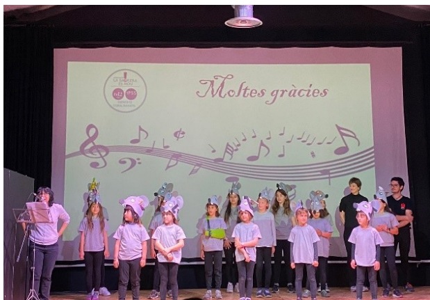
Cantata Mozart i els ratolins, 20 d'abril