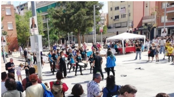
Actuació d'un grup de Tabals

Aquest any hi ha hagut un fort augment de les necessitats en les diferents escoles. De l'ajut de LSEM se n'han pogut beneficiar 423 alumnes . El total de les necessitats presentades pel conjunt d'Escoles ha estat de 46.385€. LSEM i el Firem-nos han fet una aportació de 13.000€ , que beneficiaran 423 alumnes de les 6 escoles públiques del barri de La Sagrera. Cada alumne ha rebut un ajut de 30,73 € .