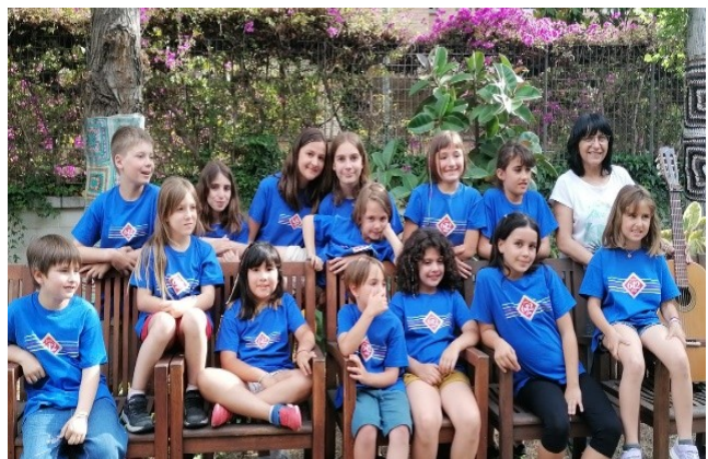
Firem-nos, 26 de maig